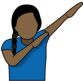
22.決勝分 “Match Point” 左手伸直、右手置於胸前， 同時向左上方舉起，手掌攤 開、掌心朝下