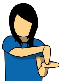
17.運動精神暫停 【Spirit Stoppage】