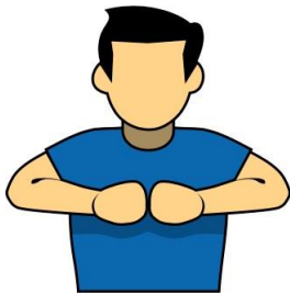
4. 爭議 【Contest】