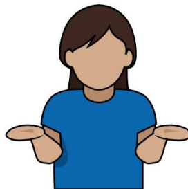
5. 無爭議 【Accepted】