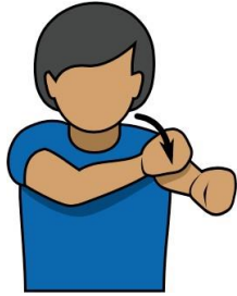
1. 犯規 【Foul】