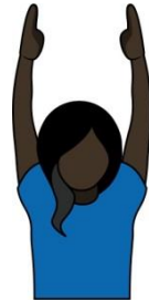
3. 得分 “Goal”