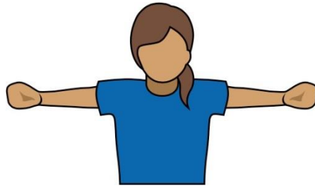
20.性別比例：女（女>男） 【Gender Ratio: Women】 雙臂各向一側伸展， 雙手握拳