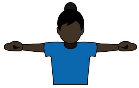
12.守盤員的違規 【Fast Count】“讀秒計數過快”