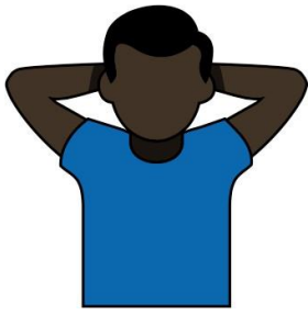
19.性別比例：男（男>女） 【Gender Ratio: Men】 雙手形成杯狀放於頭部 後方，手肘朝外