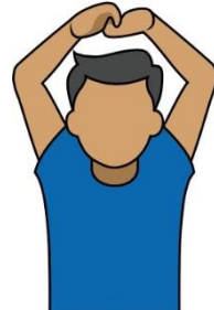
18.比賽中止 【Injury】“受傷停止” 【Technical】“技術停止”