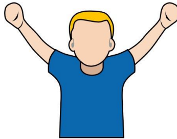
2. 違例 【Violation】