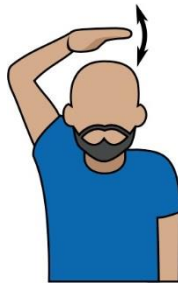
14.時間違例 【Stall】“超過規定時間未出手” 【Violation】“違例”