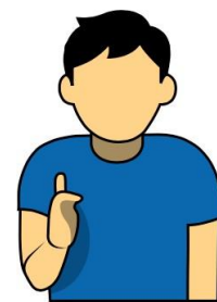
9. 飛盤未落地 “Up”