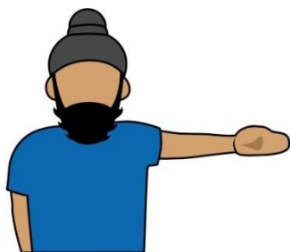
7. 界內/界外，得分區內/外 “In” “Out”

比賽繼續【Play On】 雙手手臂向下延伸在身體前方交叉擺動，手掌攤開、掌心朝下