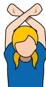
15.越位(發盤時越線) 【Off side】